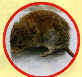
エゾヤチネズミ (体長10cm程度の小型のネズミです)